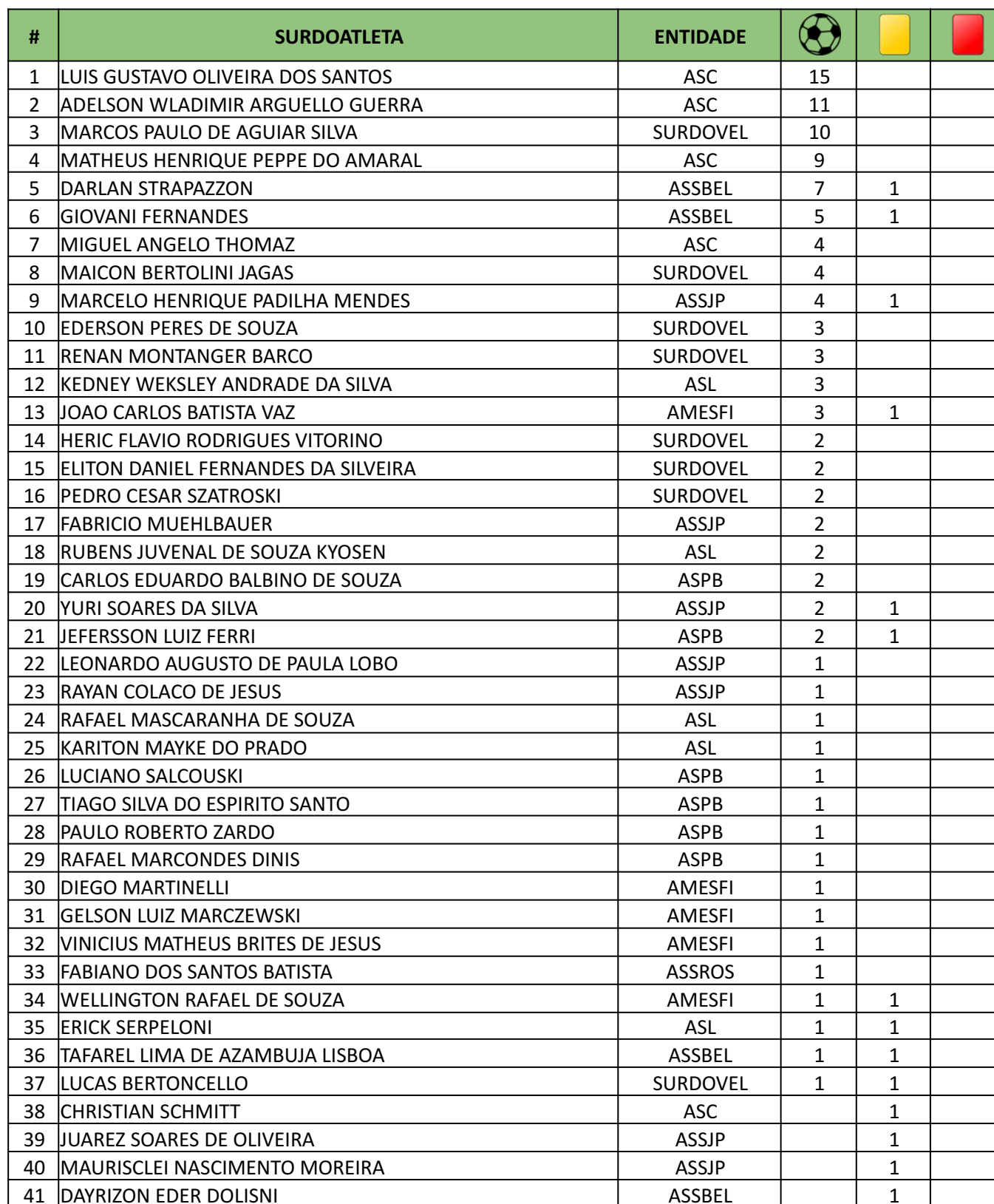
TABELA DE GOLS MARCADOS E DE CARTÕES