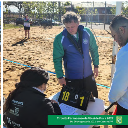
Circuito Paranaense de Vôlei de Praia 2022 Dia 20 de agosto de 2022, em Cascavel/PR