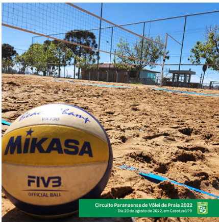
Circuito Paranaense de Vôlei de Praia 2022 Dia 20 de agosto de 2022, em Cascavel/PR