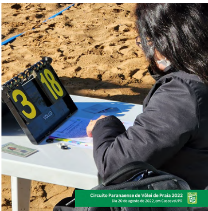
Circuito Paranaense de Vôlei de Praia 2022 Dia 20 de agosto de 2022, em Cascavel/PR