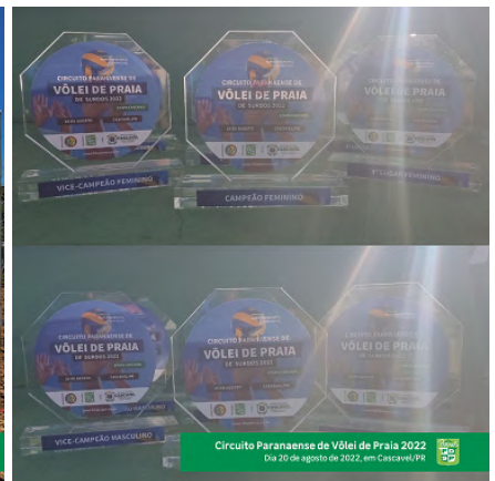
Circuito Paranaense de Vôlei de Praia 2022 Dia 20 de agosto de 2022, em Cascavel/PR