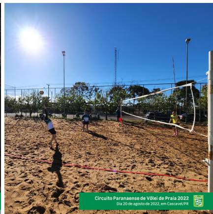
Circuito Paranaense de Vôlei de Praia 2022 Dia 20 de agosto de 2022, em Cascavel/PR